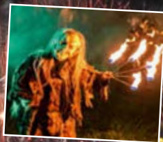
Lunch an Bord von März bis Dezember