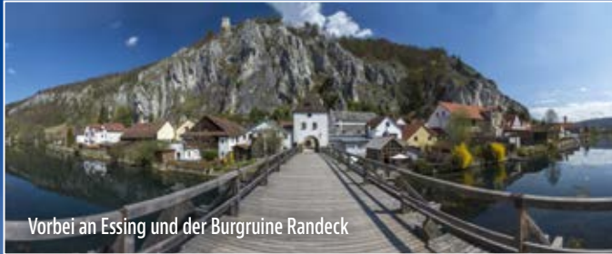
Vorbei an Essing und der Burgruine Randeck

A uf einem steil aufragenden Kalksteinfelsen über dem Altmühltal liegt die stolze Burg Prunn. Ihre majestätische Lage macht die Burg zu einer der bekanntesten Bayerns. Zudem ist sie Fundstelle der Prunkhandschrift des Nibelungenliedes. Fantastische Landschaften erwarten Sie auf dem Weg zum Luftkurort Riedenburg mit seinen romantischen Gassen und der majestätischen Rosenburg.