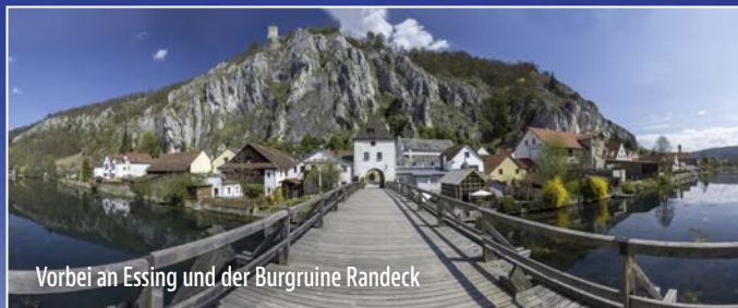
Vorbei an Essing und der Burgruine Randeck

A uf einem steil aufragenden Kalksteinfelsen über dem Altmühltal liegt die stolze Burg Prunn. Ihre majestätische Lage macht die Burg zu einer der bekanntesten Bayerns. Zudem ist sie Fundstelle der Prunkhandschrift des Nibelungenliedes. Fantastische Landschaften erwarten Sie auf dem Weg zum Luftkurort Riedenburg mit seinen romantischen Gassen und der majestätischen Rosenburg.